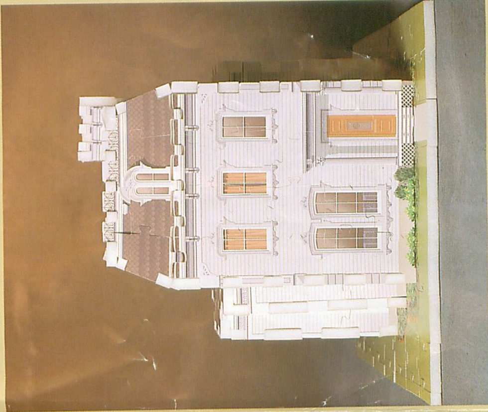
BACK / ARRIÈRE